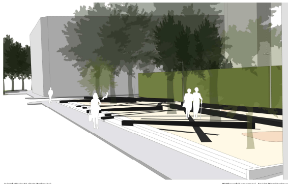
Auböck+Kárász & Lobnig/Andraschek

Download: http://www.koer.or.at/de/press/ and http://www.millisegal.at